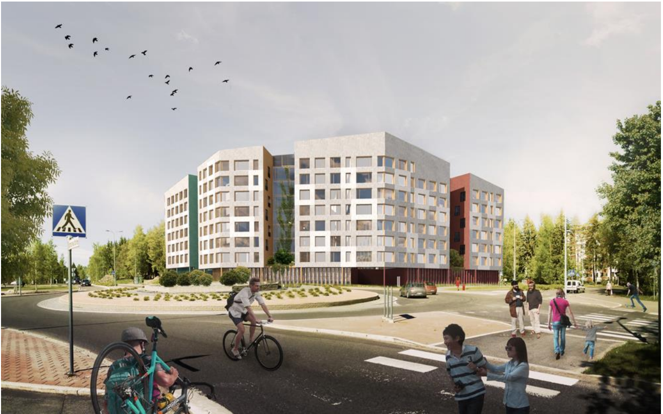
Näkymä Tesoman valtatieltä etelästä